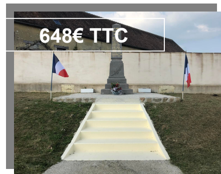
RENOVATION MARCHES MONUMENT