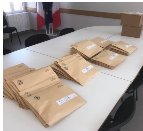
Enveloppes préparées en Mairie en vue de la distribution par les bénévoles.

Ce sont 9 bénévoles de la réserve communale de sécurité civile qui ont été mobilisés pour ces distributions. Merci à eux !