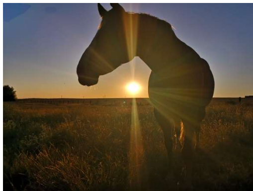
Grande gagnante du concours photo 2020 – Nathalie RAOULT