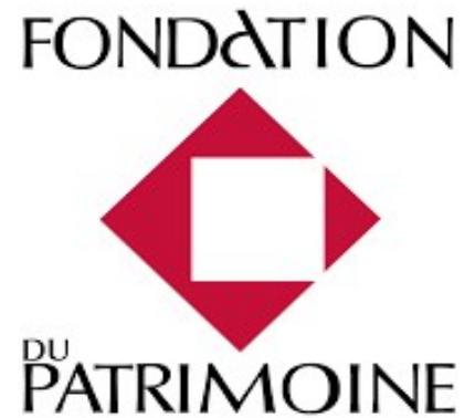
Logo de la Fondation du patrimoine