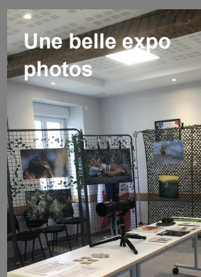
Une belle expo photos