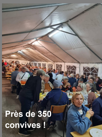
Près de 350 convives !

Une édition 2023 victime de son succès. Le nombre trop important de convives (350, un record !) a perturbé le fonctionnement du service. Ce fut malgré tout une belle journée ensoleillée.