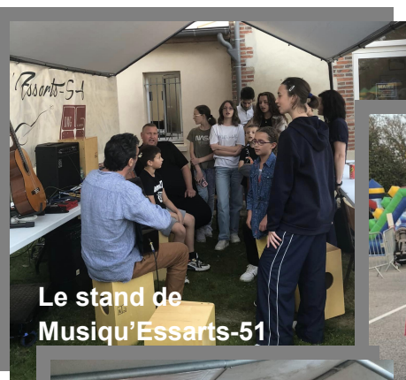
Le stand de Musiqu'Essarts-51