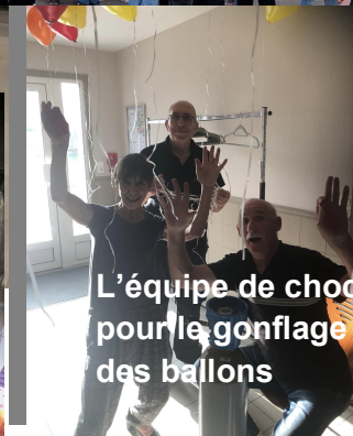
L'équipe de choc pour le gonflage des ballons

On ne peut que remercier chaleureusement les structures participantes : la commune, le CFJE, l'APE ou encore Musiqu'Essarts-51. Un grand merci aux bénévoles !