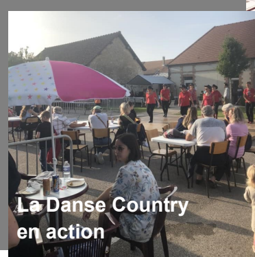
La Danse Country en action