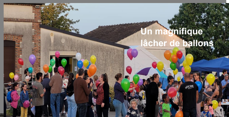
Un magnifique lâcher de ballons