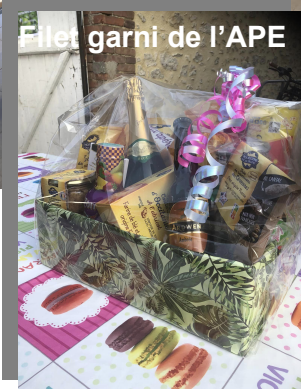
Filet garni de l'APE